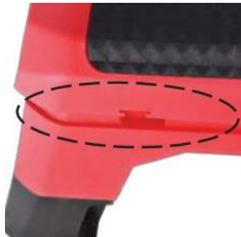
Press the top lever again and set the required position up to an angle of 85°