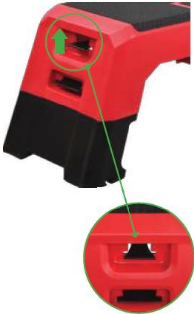
Separate the backrest from the rest of the step