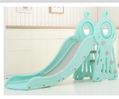
6. Připevněte druhou půlku rámu