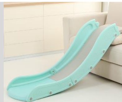
3. Připevněte druhý boční panel