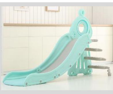
5. Připevněte schody