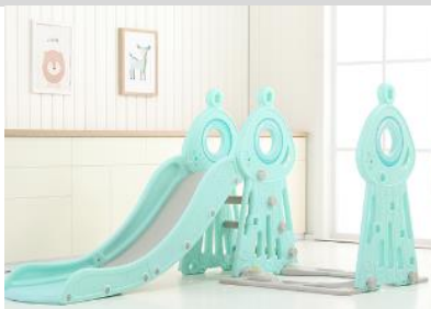
8. Připevněte třetí nosný panel