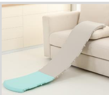
1. Spojte obě části skluzavky