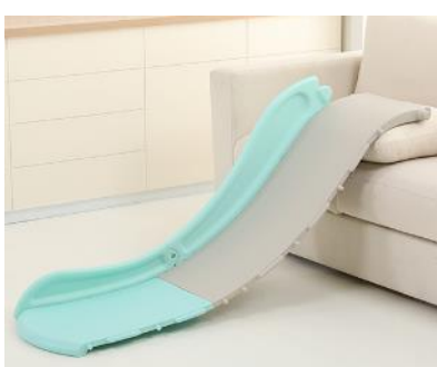
2. Připevněte boční panel