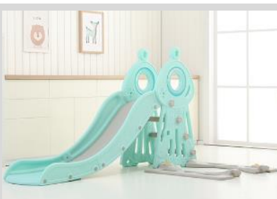
7. Připevněte základnu pro houpačku