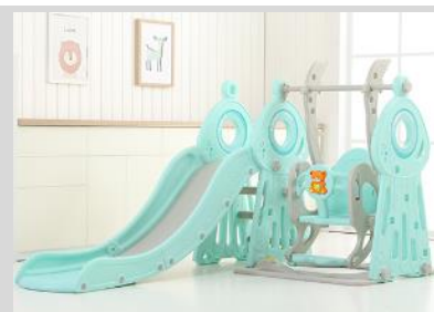
9. Připevněte houpačku